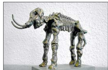
Für Verdienste um die Stadt Ahlen wird seit 2006 der Wirtschaftspreis verliehen. Als Vorbild für die Skulptur dient das Mammut mit all seinen Fehlern, wie breiter Beinstellung und zu kleinem Schädel.