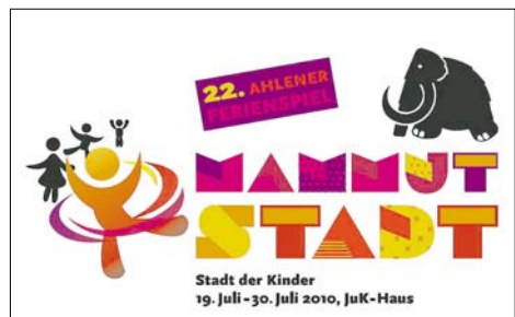
Im Zeichen des Mammut führt die Stadt Ahlen ihre Ferienspiele durch. Die Stadt der Kinder heißt Mammutstadt, ihr Wahrzeichen haben die kleinen Bewohner in diesem Jahr „Mammi“ getauft.